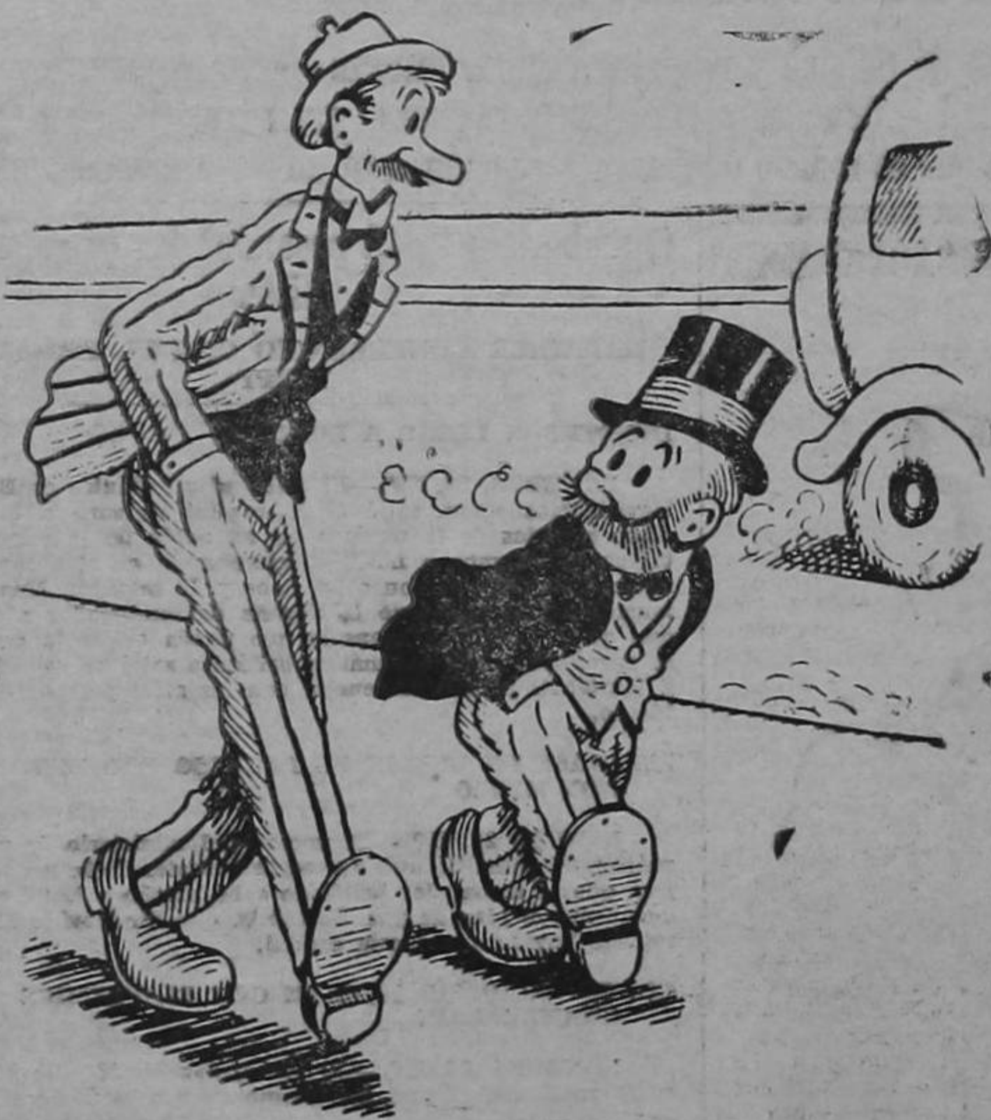
Benitín y Eneas.

En el caso de emergencia, ambas medidas son buenas, desde luego.